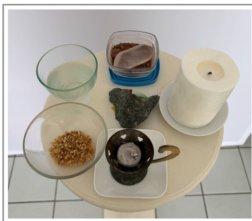
La pierre verte au centre, dans notre Temple à Saintes (17)

9 - Peut-être êtes-vous insignifiants dans le monde des hommes, qui ne sait pas discerner votre beauté et votre lumière ? Alors, regardez cette pierre et suivez son exemple, faites-vous aimer du monde supérieur. »